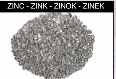
ZINC - ZINK - ZINOK - ZINEK