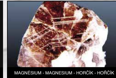
CUIVRE - KOPER - MEÛ - MÛÛ FER - IJZER - ŒELEZO - ŒELEZO SILICE - KIEZELAARDE - SILICA - KRÛMIK MAGNÛSIUM - MAGNESIUM - HORŒIK - HORŒIK